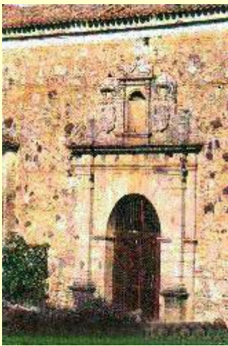
Portada del convento

Realización destacada resulta el enorme Convento Franciscano , obra del siglo XVI, en cuya enorme iglesia se conservan esgrafiados de interés. Deshabitado desde el siglo XIX, sus antiguas dependencias están siendo adaptadas en la actualidad como centro cultural.