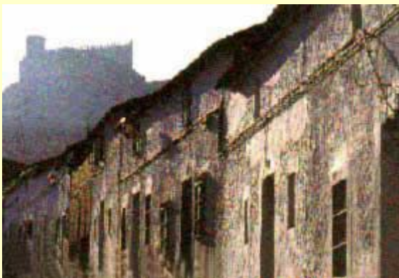
Calle de Puebla de Alcocer y castillo al fondo

La imagen de la propia Puebla recostada sobre la falda de la sierra, con la silueta de su soberbio castillo recortándose sobre el cielo, dominando el territorio circundante, constituye también panorama que merece la pena contemplar, y que por sí solo justifica la visita al lugar.