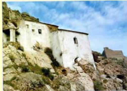
Ermita de la Virgen de la Cueva

En lo alto de la sierra, junto a la fortaleza, abrumada en su humilde arquitectura por la inmensidad del paisaje, se enclava, encaramada en lo más abrupto del roquedal, la Ermita de Nuestra Señora del Risco, más popularmente conocida como " La Virgen de la Cueva ", en cuyo escabroso emplazamiento, todos los años, se celebra una romería famosa en todo el partido judicial.